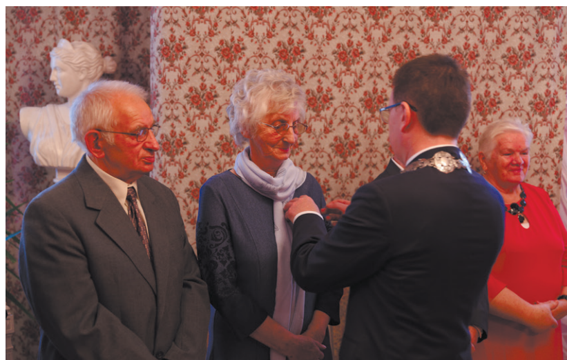
RENA I JAN WORKOWIE

– Jest wiele jubileuszy godnych świętowania, ale na szczególną uwagę zasługują wspaniałe rocznice pożycia małżeńskiego – podkreślił J. Górczyński. – Wyrażam szacunek i podziw dla wytrwałości i niezłomności par małżeńskich, które pomimo wielu przeciwności losu dotykających życia, doczekały tak pięknego jubileuszu jakim są złote, a tym bardziej diamentowe gody. Dzisiejsi jubilaci powinni być wzorem dla młodych. Są przykładem, że prawdziwe zgodne i dobre małżeństwo to takie, które przetrwa wszystkie życiowe zawieruchy, w oparciu o wzajemne zrozumienie, tolerancję i szacunek.